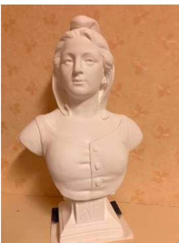
Ce nouveau buste de Marianne a trouvé sa place dans la salle communale.

✓ Dates de fermeture de la mairie cet été : du 12 au 23 août 2024.